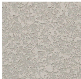
ลายแบน-ใหญ่