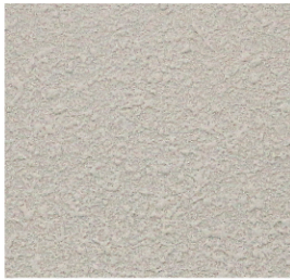
ลายนูน-เล็ก

อะคริลิกพ่นสร้างลายสไตส์สตักโก ที่เพิ่มคุณสมบัติพิเศษให้มีความยืดหยุ่นสูง ลดปัญหาการแตกร้าว ใช้สร้างลวดลายเสมือนหิน เพื่อเพิ่มเอกลักษณ์และมีติดกับผนังและฝ้าเพดาน แข็งแรงทนทาน ทั้งยังสามารถปกปิดรอยแตกร้าวได้ดี ยึดเกาะได้ดีกับหลายพื้นผิว เช่น คอนกรีต ปูนฉาบ แผ่นไฟเบอร์ซีเมนต์ และอีปซัมบอร์ด ใช้งานง่าย โดยใช้เครื่องพ่น มีส่วนผสมของสารยับยั้งการเกิดเชื้อรา และตะไคร่น้ำ ทนต่อสภาวะอากาศ ใช้งานได้ทั้งภายในและภายนอก