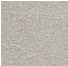
ลายนูน-ใหญ่