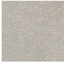
ลายแบน-เล็ก